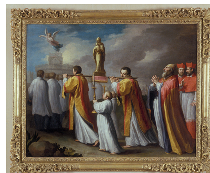
23. Horace Le Blanc Saint Grégoire le Grand en procession vers le château Saint-Ange lors de la peste de Rome de 590 Huile sur toile, 1625