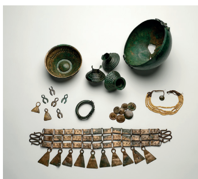
20. Blanot (Côte d'Or), dépôt d'objets de l'Age du Bronze Trésor acheté avec l'intervention du Fonds Régional d'Acquisition pour les Musées.