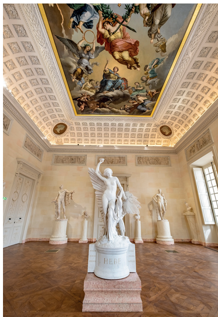
7. Salle des Statues, Musée des Beaux-Arts de Dijon