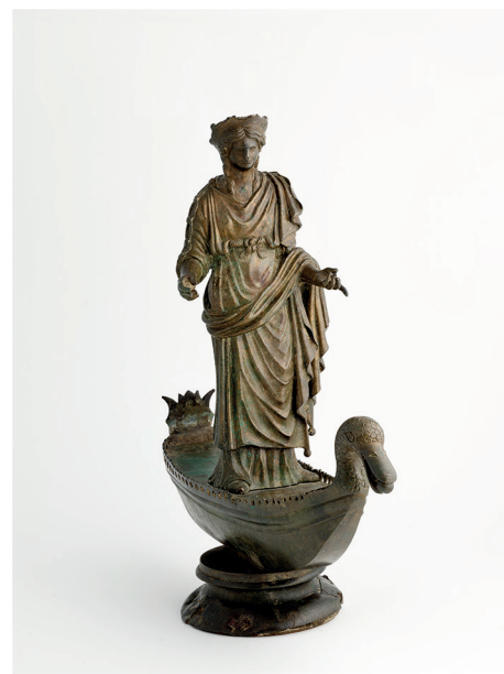
19. Anonyme, Sequana , bronze avec soudure en étain des trois parties, Gallo-romain Inv. 4690