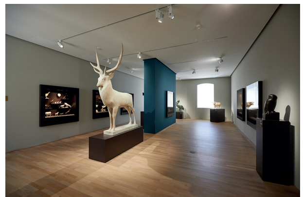
4. Salle Pompon, Musée des Beaux-Arts de Dijon