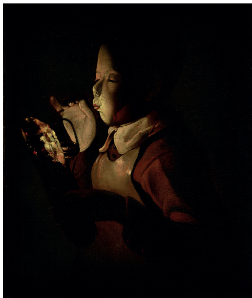
10. Georges de La Tour, Le Souffleur à la lampe , vers 1640 Huile sur toile, Dijon, Musée des Beaux-Arts, Inv. DG 827 Donation Pierre et Kathleen Granville, 1974