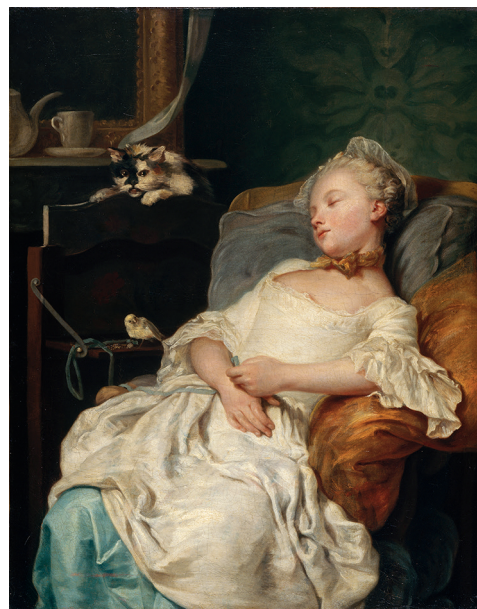
11. Jean-François Colson, Le Repos , huile sur toile. Entré au musée avant 1818