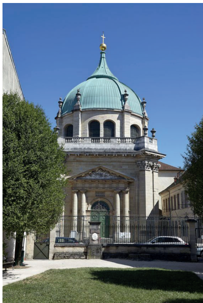
21. Musée d'Art sacré, l'église des Bernardines, vue depuis le jardin Jean de Berbissey, Dijon