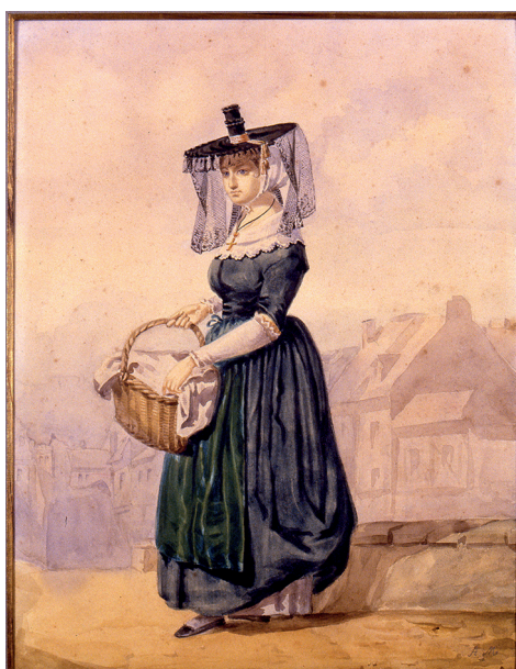
29. A. Meslier, Aquarelle représentant une femme en costume bressan, 1830