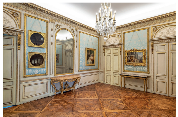
6. Salon Gaulin, Musée des Beaux-Arts de Dijon