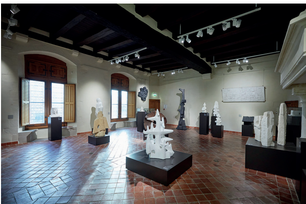
5. Salles contemporaines, Musée des Beaux-Arts de Dijon © Musée des Beaux-Arts de Dijon/ Philippe Bornier © ADAGP, Paris 2024