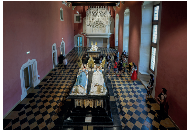
2. Salles des tombeaux des Ducs de Bourgogne, Musée des Beaux-Arts de Dijon