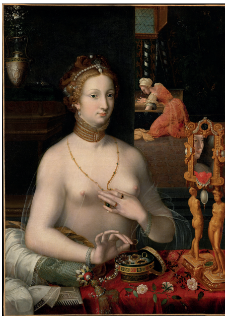
8. Anonyme de l'Ecole de Fontainebleau, Dame à sa toilette , huile sur toile, fin XVI e siècle, Saisie révolutionnaire, collection Legouz à Dijon, 1792