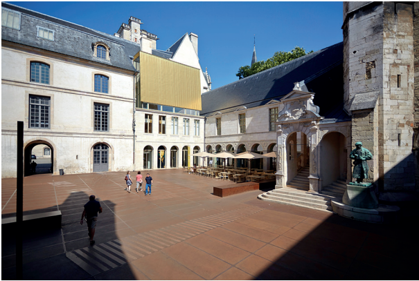
1. Vue du Musée des Beaux-Arts de Dijon depuis la Cour de Bar