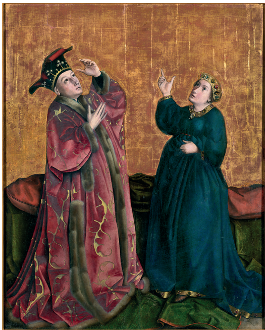
Konrad Witz, L'Empereur Auguste et la sibylle de Tibur