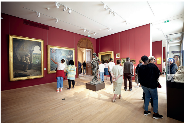
3. Salles XIX ème , Musée des Beaux-Arts de Dijon