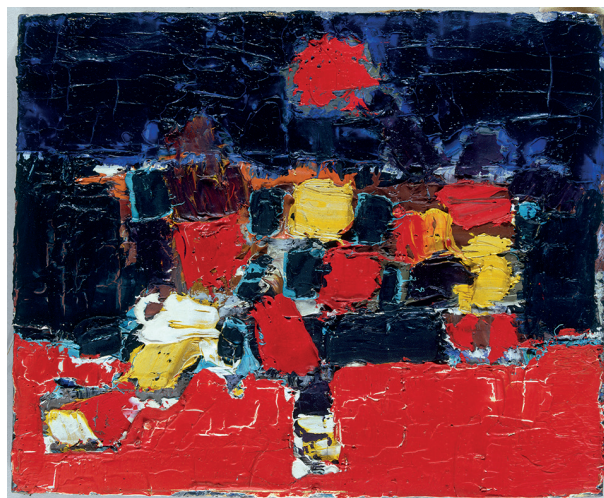
13. Nicolas de Staël, Les Footballeurs , huile sur toile, 1952