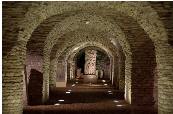
17. Salle romane, collections gallo romaines, Musée archéologique de Dijon