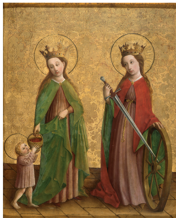
Maître de la Passion de Darmstadt