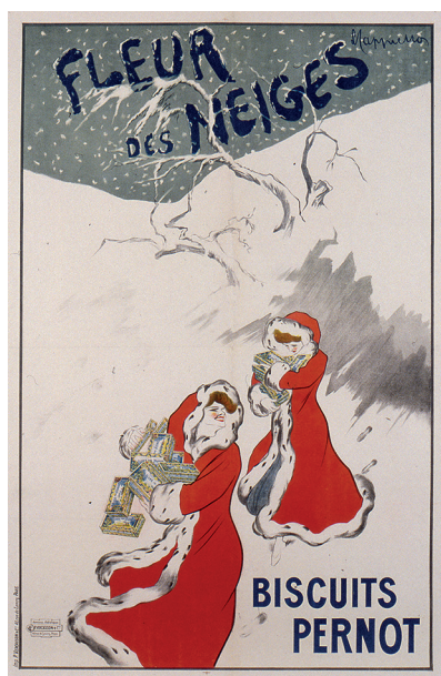
28. Léonetto Cappiello, Affiche "Fleur des Neiges" des Biscuits Pernot, 1905