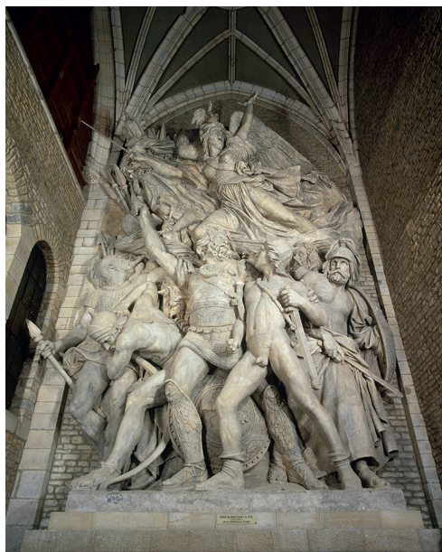
14. Copie d'après François Rude, Le Départ des Volontaires de 1792 , moulage en plâtre, patine brun clair, 1896-1938