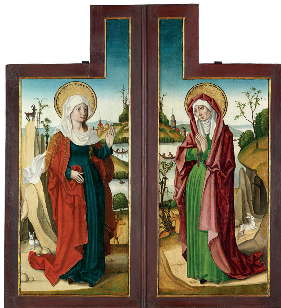
Atelier du Maître à l'œillet, La Visitation ;

© Musée des Beaux-Arts de Dijon/François Jay