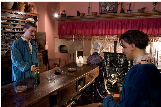
26. Musée de la Vie bourguignonne, reconstitution d'une cuisine bressane