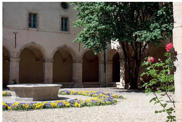
27. Musée de la Vie bourguignonne, cloître du monastère des Bernardines