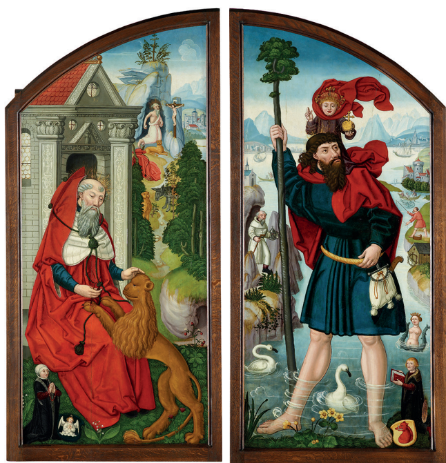
Suisse, Anonyme Saint Jérôme et saint Christophe avec donateurs 1516