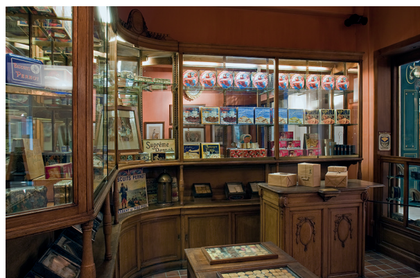
25. Musée de la Vie bourguignonne, La biscuiterie, Pernot