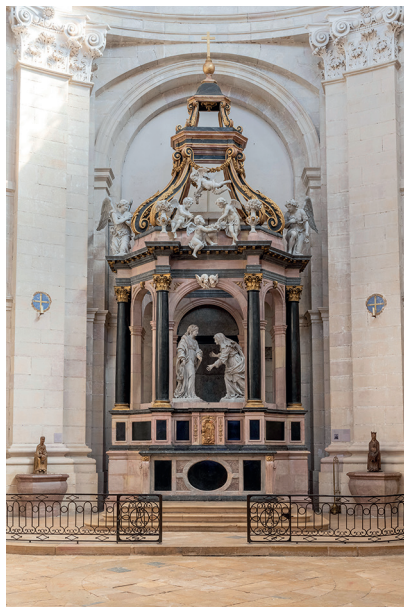
22. Jean Dubois, Autel à baldachin abritant le groupe de la Visitation , XVII e siècle