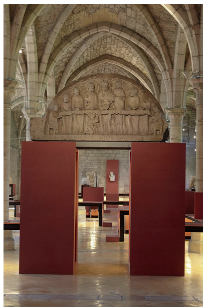
18. Le dortoir des bénédictins, Musée archéologique de Dijon