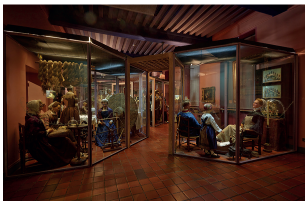
24. Musée de la Vie bourguignonne Perrin de Puycousin, Galerie des Âges de la vie