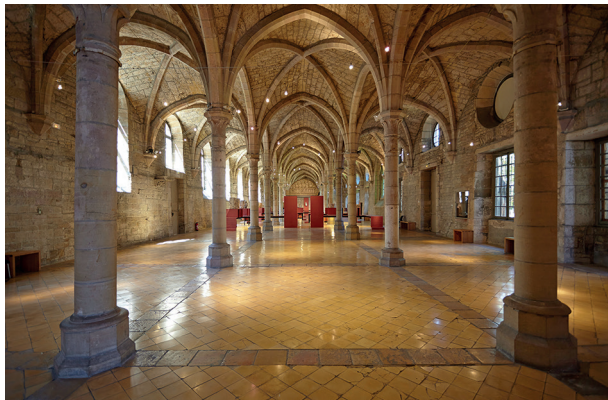
16. Le dortoir des bénédictins, Musée archéologique de Dijon