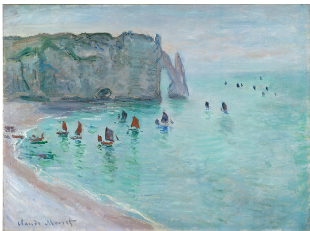
12. Claude Monet, Étretat. La Porte d'Aval : bateaux de pêche sortant du port , huile sur toile, vers 1885