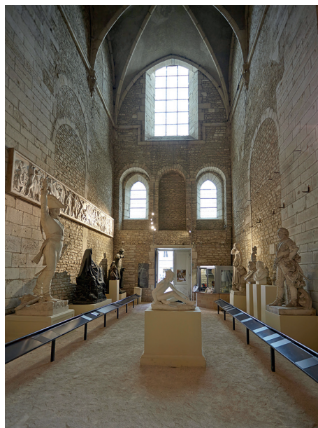
15. Musée Rude