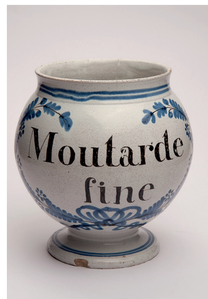
30. Pot à moutarde en faïence de Dijon, XIX e siècle