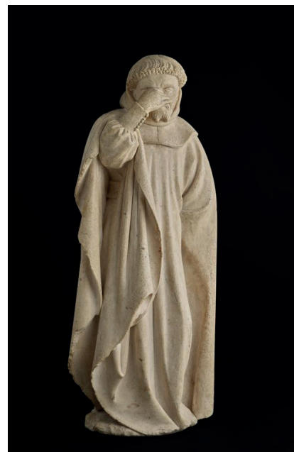
9. Claus de Werve, Pleurant n°17 du tombeau de Philippe le Hardi, vers 1410 Albâtre Dijon, Musée des Beaux-Arts, Inv. 2023-2-1 Transfert de l'Etat à la Ville de Dijon, à titre gratuit